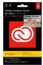
アドビシステムズ Adobe Creative Cloud 大学生協専用 ソフトカード版 1年コンプリート プラン 税込組価 ¥25,880