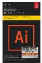
アドビシステムズ Adobe Creative Cloud 大学生協専用 ソフトカード版 1年 Illustrator CC 税込組価 ¥12,700