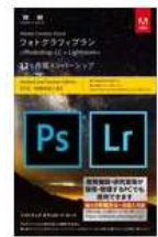
アドビシステムズ Adobe Creative Cloud 大学生協専用 ソフトカード版 1年 フォトグラフィ プラン 税込組価 ¥11,400