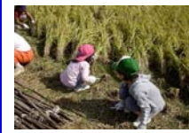
子どもたちもがんばりました