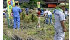
こんな風にまとめて藁でくっつけて干すことも学びました。