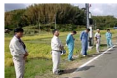
閉会式の様子。お疲れ様でした。