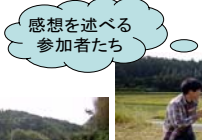
感想を述べる参加者たち