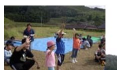
じゃんけん大会と景品をもらう子どもたち