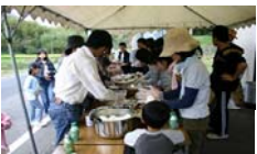
前回と同じようにオニギリを作って