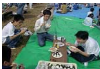
今日のメニューは、豚汁・おにぎり・つけもの・豚串・ウインナでした