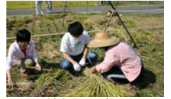
お姉さまから教えてもらってます