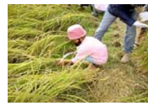
田植えの時は、ほんの一部しか植えられなかったけど、今回は全部刈ってしまいました。