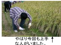
やはり今回も上手な人がいました。