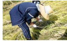
やはり慣れてます?でも初心者です