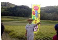
今回もお話を頂きました。