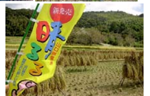
全てが終わった田んぼ

今回の稲刈りは、前回よりも学生の参加者が増えました。この日初めて会う山大生どうしの交流もできました。