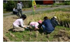
大学生と子どもたち