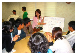
パソコン総合サポート

このダイジェスト版を読んで、みなさんの声を生協に、総代会にお寄せ下さい。 (詳しい議案書は生協本部とショップにあります)