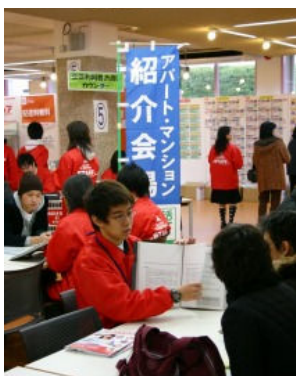
新入生総合センターで活躍する新学学期アドバイザーたち