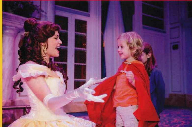
マジックキングダム・パーク