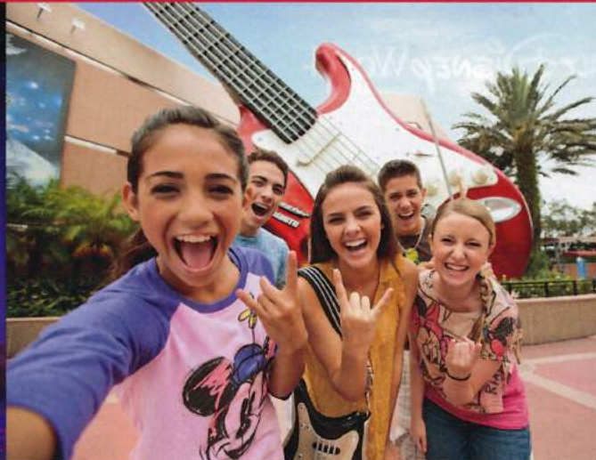
ディズニー・ハリウッド・スタジオ